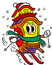
はんしんキャラクター だし太郎